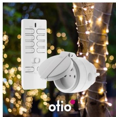
Prise extérieure radiofréquence + télécommande Référence : 751067

Vous souhaitez offrir des objets connectés ? Retrouvez ci-dessous une sélection pour démarrer son installation :