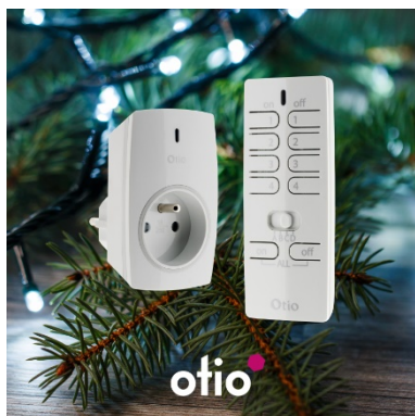
Prise intérieure radiofréquence + télécommande Référence : 751065